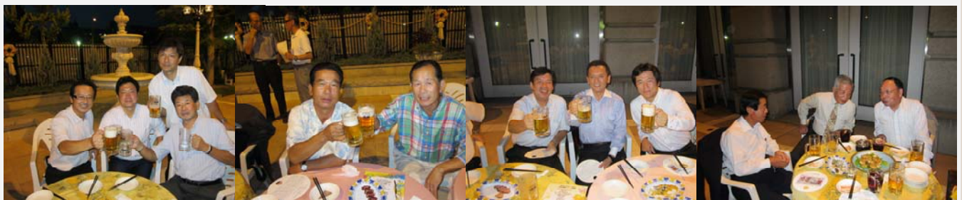
談笑をするメンバー