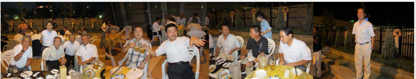
談笑をするメンバー