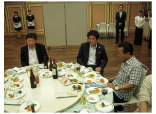
始めは緊張していた川崎年度予定者も、食とお酒が進むとともに打ち解けて・・・