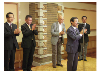
中締めは、川崎次年度会長と、4人の新入会メンバーで一本締め！！