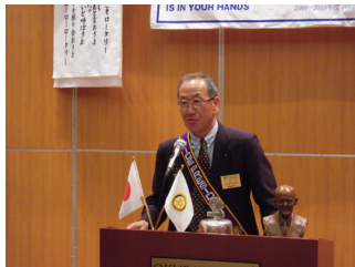
下村第二クラブ奉仕委員長