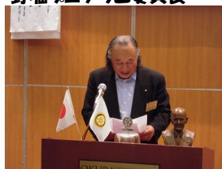
綿引ロータリー財団委員長