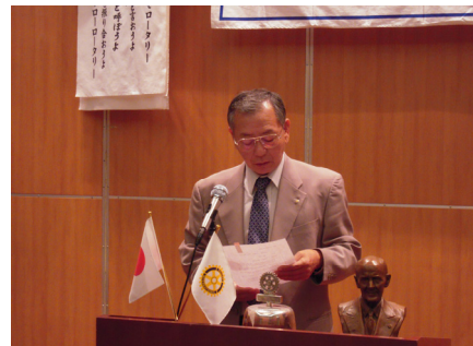
岡添会員増強・会員選考 職業分類委員長