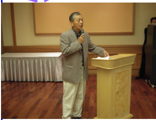
岡添委員長司会で勉強会が開催されました