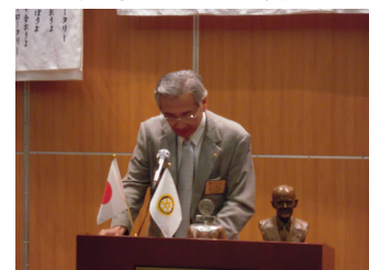
宮川米山奨学会委員長