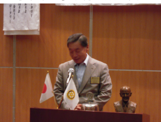
井田人間尊重・環境保全委員長