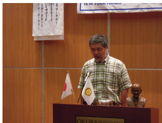
野堀プログラム委員長