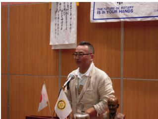
上野ロータリー情報委員長