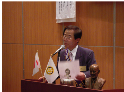
川崎第一クラブ奉仕委員長