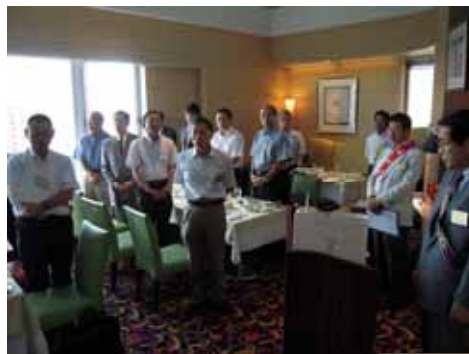
ロータリーソング斉唱