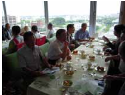
外の景色も目に優しく