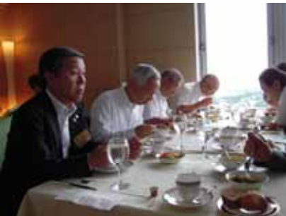
対面で会話も弾みますね