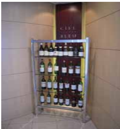
会場はオークラフロンティア 11階「CIEL BLEU」

また、7月会員誕生祝贈呈、新入会員紹介（矢島定男会員）と行事が目白押しの状況でした。