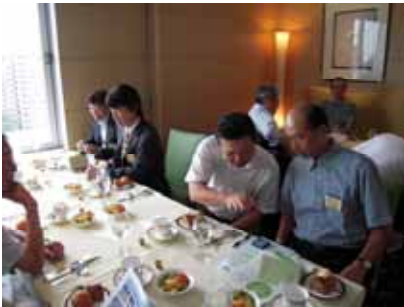
いつもと違う例会風景