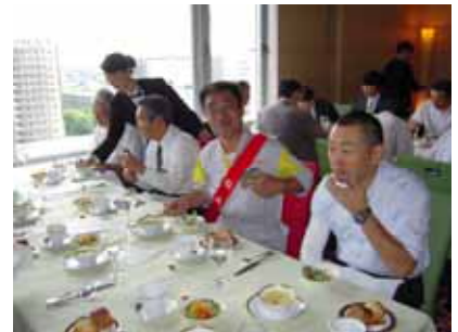
本当に明るい食事風景。