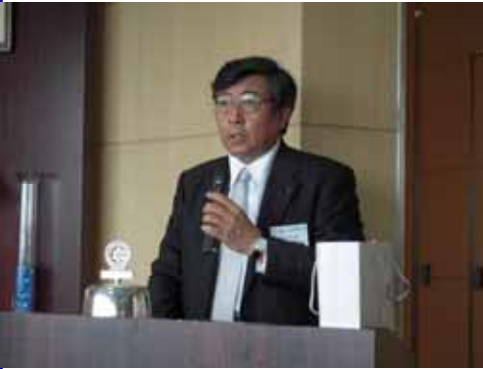
保延ガバナー補佐