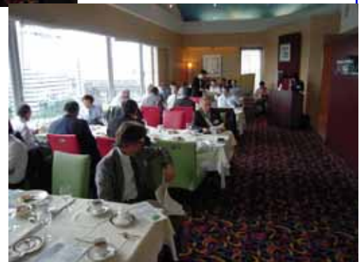
いつもと雰囲気は違います