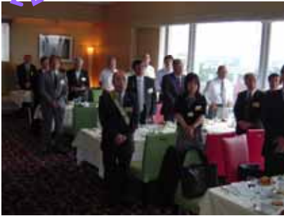
地上11階のレストランで・・