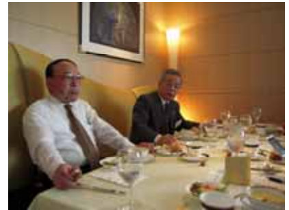
特別席 その 2