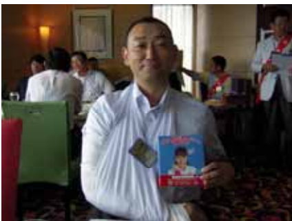
痛々しい姿の菅原会員