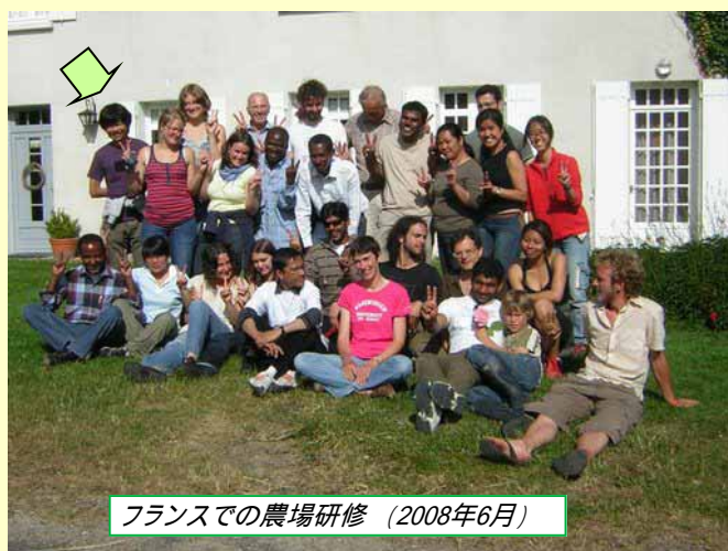
フランスでの農場研修 (2008年6月)

2008年10月18日にはオランダ全土にロータリー国際親善奨学生として留学している学生のオリエンテーションがあり、Van de Weg氏と一緒に参加してきました。全部で10人ほどの奨学生が参加しましたが、マルチイヤーとしてオランダ生活2年目を迎えるのは私だけだったので、オランダでの生活に関するショートスピーチを委員会の方から頼まれました。自分の話が新しい奨学生に少しは役立てたのではないかとと思っています。オランダ2年目ということもあり、もう少しロータリーとの関わりを深められればと感じます。