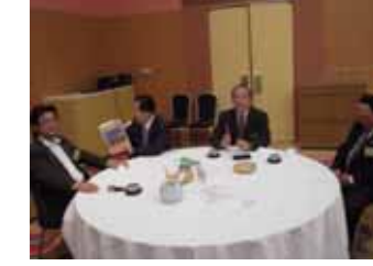
ロータリーの友紹介