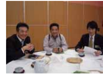
安藤委員長おひさです。