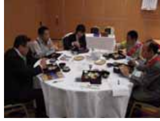
安藤委員長食べる!