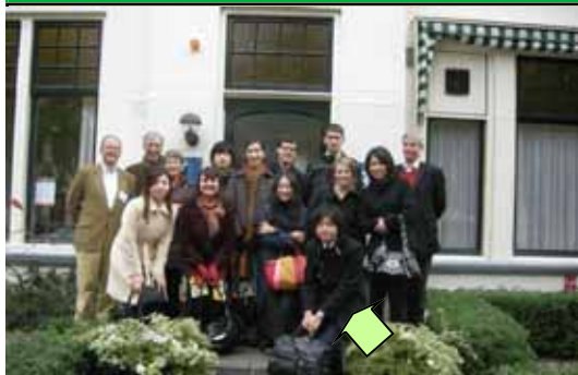
オランダ全土の学生が集まったオリエンテーション (2008年10月18日)