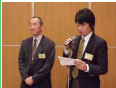
小城親睦委員長 下村社会奉仕委員長

ロータリーの森創り(15日) 「ちゃんちゃんやき+バーベキュー」 ちゃんちゃんやきは、ちゃんちゃんとして手軽に作れる意味や、父ちゃんからちゃんこ鍋と同じ理由でついたなど諸説あります。鮭を用いて旬の野菜を手軽に炒めて食べる手軽な料理です。お楽しみに！！