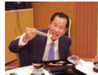
くりがおいしいです!