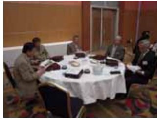
資料に目を通し準備OK!