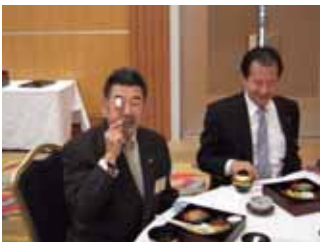
視力検査ではありません