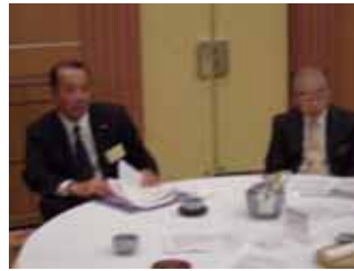
すいませんちとぼけてます!