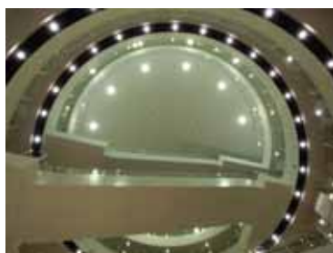
メインコートを見上げると！