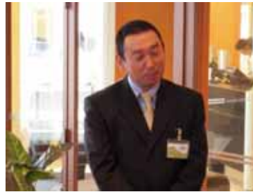
菅原職業奉仕委員長あいさつ