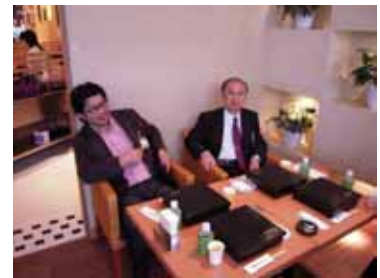
アウトモール 『Vimi Collection』 内で食事！！