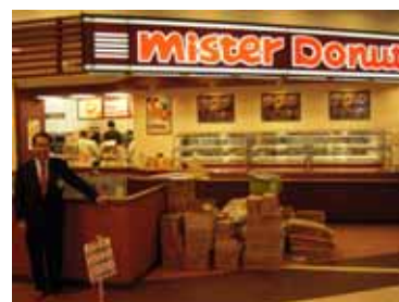
宣伝！宣伝！メインコート入口すぐ。