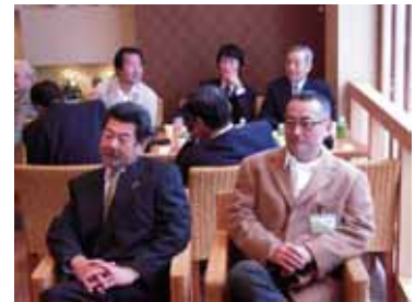
皆さん、何か落ち着かない様子です。まだ、オープン前ですから。