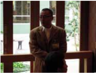
上野会長あいさつ