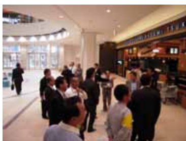
メインコート『カスミ』入り口