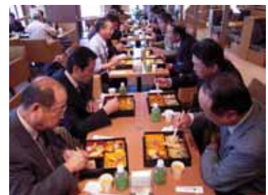
このエリアだけで食事しています（まわりは従業員教育中でした）。