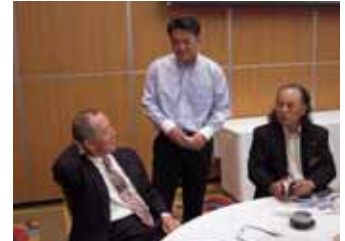
野球部首脳陣密談！