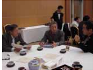
市況について情報交換