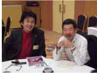
最近ツーショット多いです