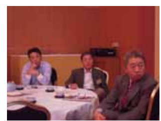
委員長報告に聞き入る