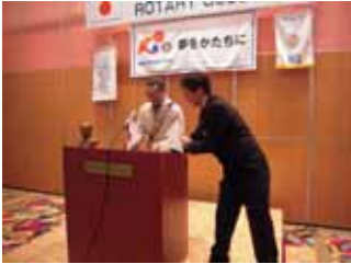
点鐘できませんぞ！