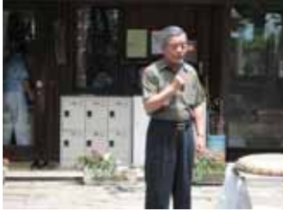
会長挨拶に始まり