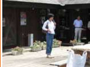
ジャイカの皆さん