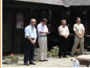
来賓の直江ガバナー補佐