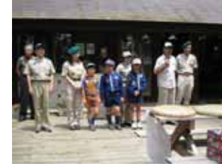
ボーイスカウトのみんな