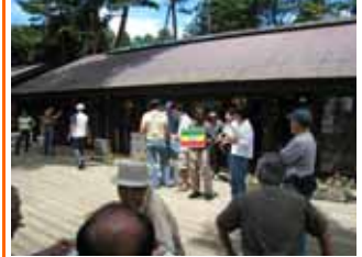
さまざまな言葉で