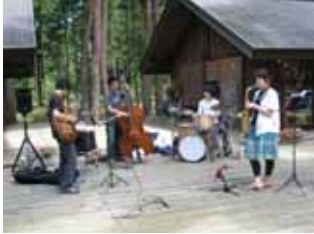
ジャズ愛好会の皆さん