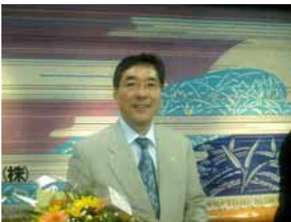
増山前会長、塚原前幹事一年間ご苦勞様でした。そしてお疲れ様でした。