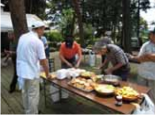
ご馳走食べながら