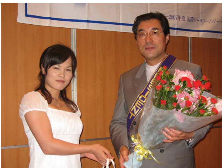
増山会長に花束を贈呈する ローターアクト竹林会長