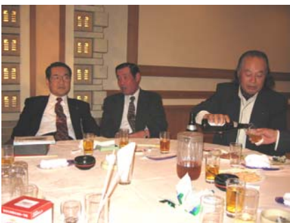
毎年、毎日飲んでいます！