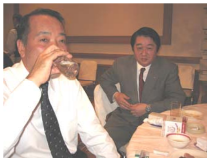
私のほうがうまいな。 (ピッチングよりサンドかな?)