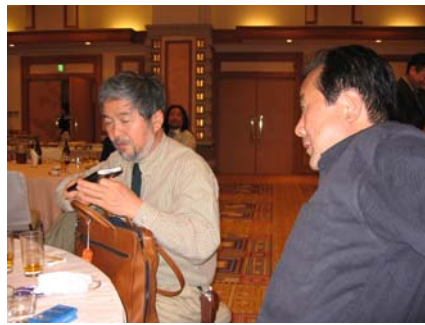
明日も飲み会だなあ。