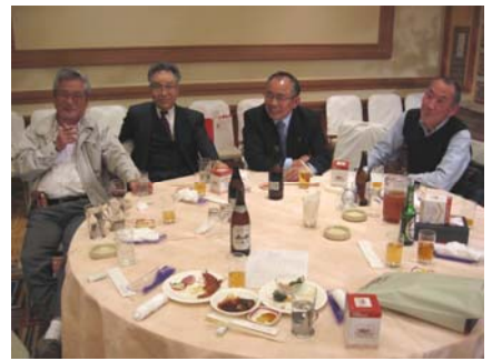
毎日飲んでいます！