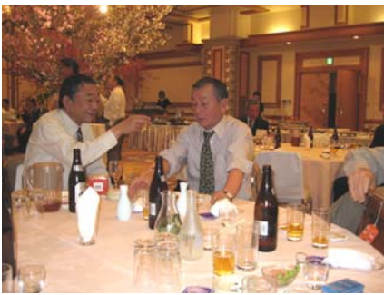
桜の木の下でのお酒は最高です。