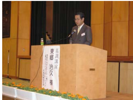
東郷会員の基調講演