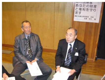
大人になって一番強いのは、 法を知っていることなん ですよ。そうそう。