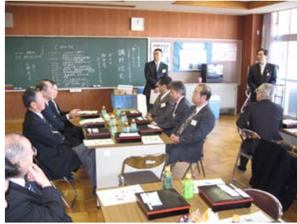
出番を待っているローアリアン (まるで職員室のようです。)