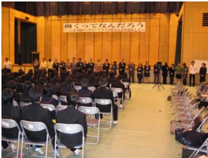
中学2年生達を前に講師陣が布陣