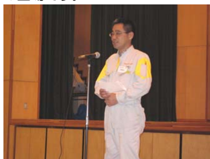
皆葉会員のお礼の言葉。職 業奉仕委員長と豊里中PTA 会長の二つの立場です。