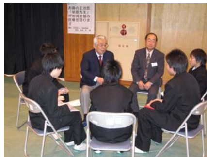
真剣に話を聞く生徒達。名 字だけで住んでいる地区と お父さんの名前がわかりま す。地域密着医療