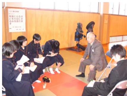
生徒達が真剣にメモを取 っています。まるで校長先生 のようです。