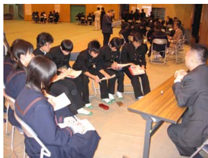
薬の名前は沢山あります。と ても覚え切れません。じゃ 今から勉強して覚えよう！