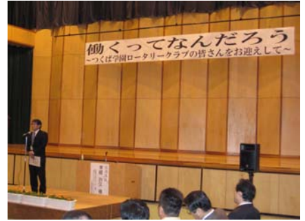
働くってなんだろう。