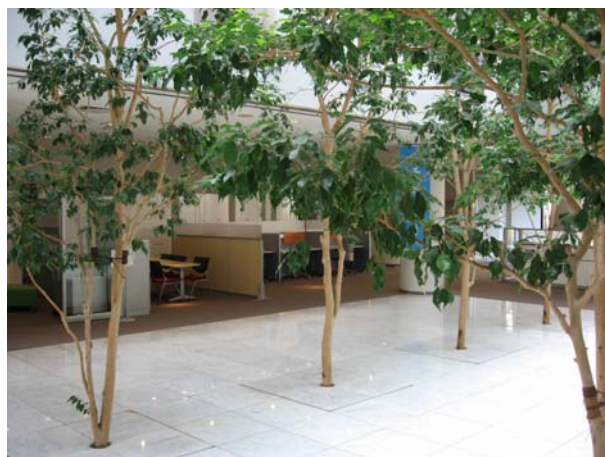
緑の木が生い茂ったロビー