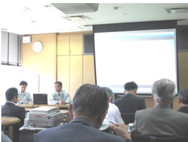
ビデオで岡村製作所の歩みを鑑賞