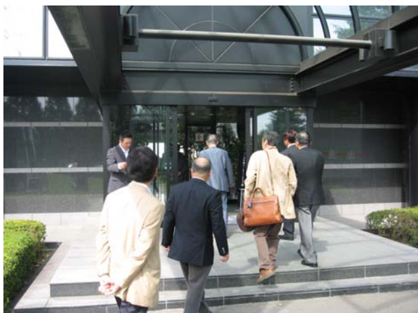
綺麗な玄関から入場するロータリアン