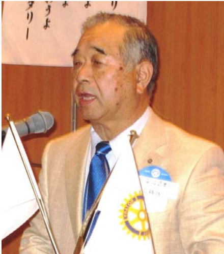
直江第七分区ガバナー補佐