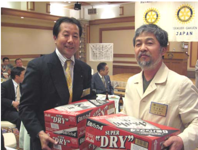
3クラブゴルフ大会でチーム優勝を果たした つくば学園RC