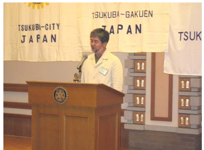
つくば学園RC 野堀会長