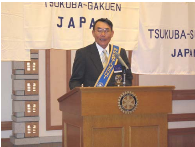
つくばサンライズRC 石川会長