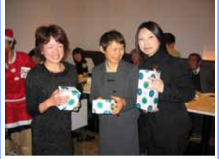
ビンゴのプレゼントを手に 三姉妹?!