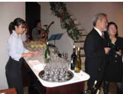
色々なお酒があります。