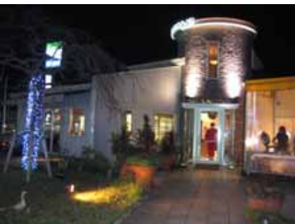
ライトアップが綺麗です。