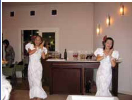
真冬のハワイアン。