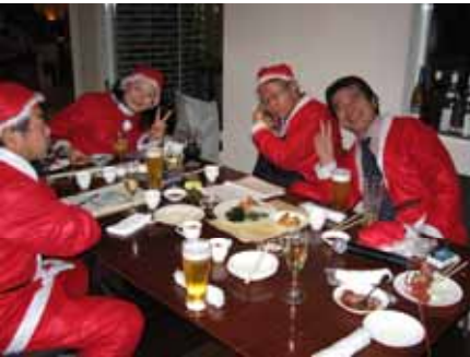
サンタの酔っぱらい。