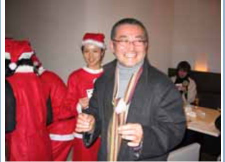
にやける上野会員。