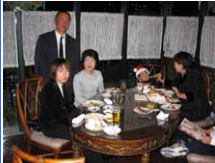
下村会員ファミリー！