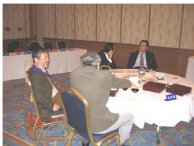
各担当毎に別れて準備の打合せをする各会員