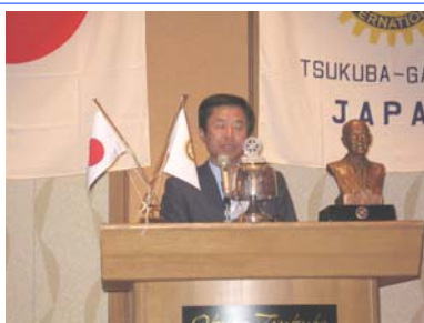
川崎 記念事業実行委員長