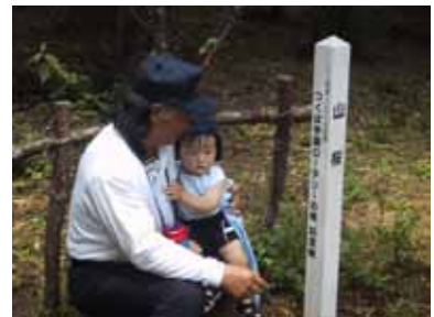
この木、ボクと同じ歳？