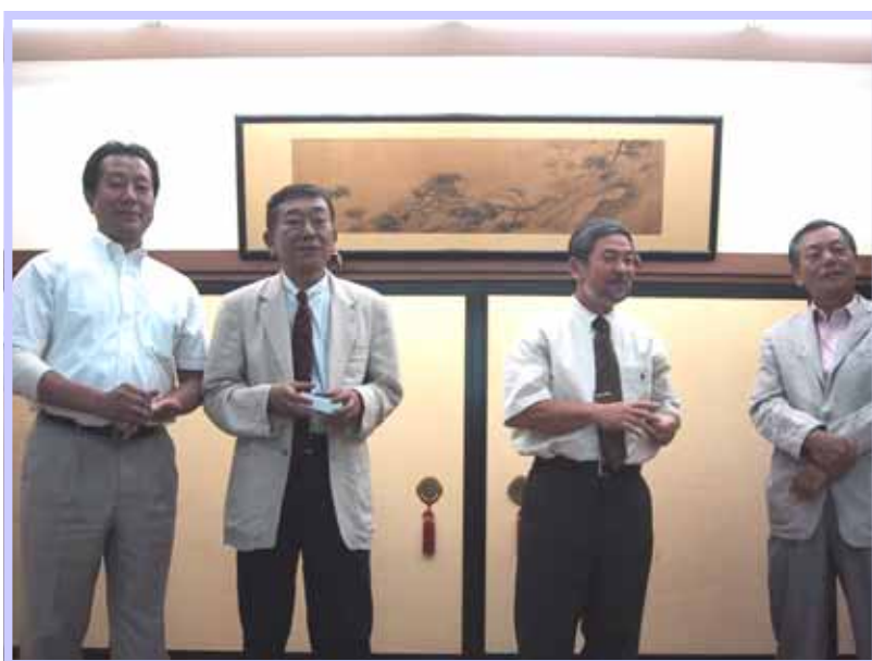
中山新幹事と飯田直前幹事