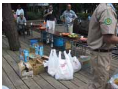
キッチンと持ち帰りましょう！