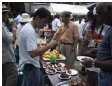
どれもがみんな美味しそう！