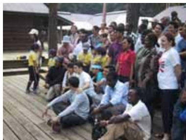
さぁ、何カ国が集結しましたか？