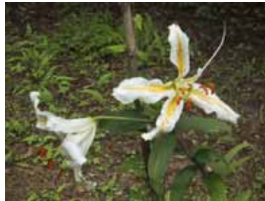
綺麗に咲き誇ったヤマユリの花