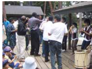
リズム感が違います！