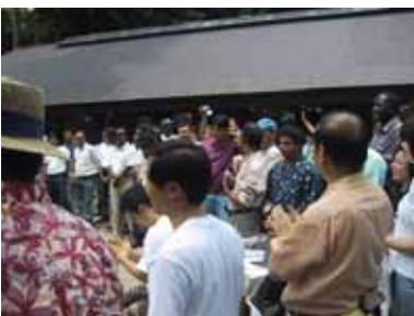
さあ、パーティーが始まるよ！