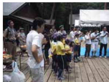
ボーイスカウトの面々