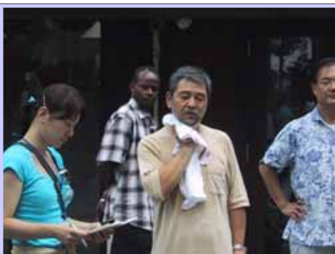
一番働いていた野堀会長