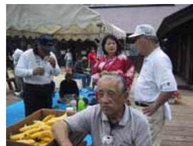
ビールのつまみにはバナナ！