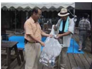
飲んだ空き缶はこの様に