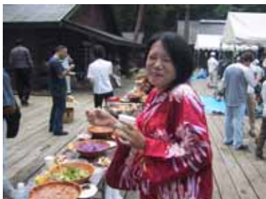
カラフルなサラダ類と浴衣