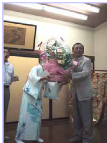
野堀新会長と岡添直前会長