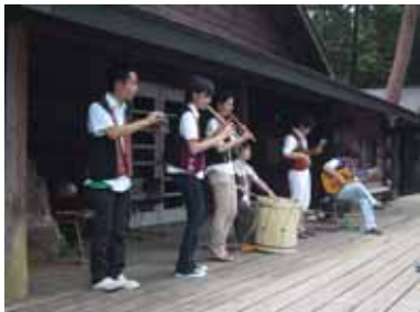
筑波大学フォルクローレ愛好会 による演奏