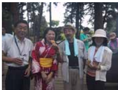
暑さの中にも涼しい笑顔！