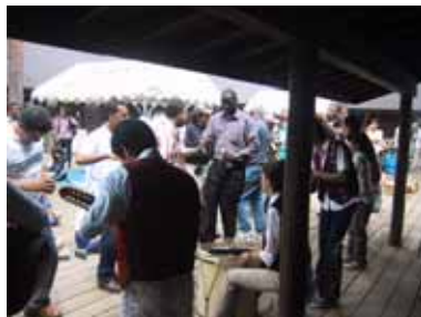
リズムに踊り出すJICA参加者