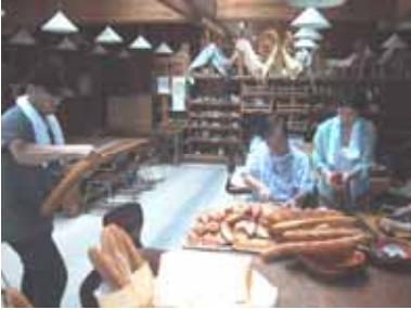
準備に余念のない面々