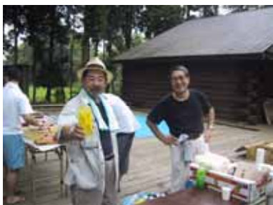
「300円だ！」と本職みたい